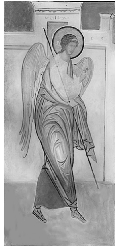
Дионисий. Архангел Гавриил

Выставка предоставила уни- кальными возможностями озна- комления с произведениями фресковой живописи Руси, ранее не выставлявшимися в Беларуси. Сами фотоизоб- ражения обладают реали- стичностью и высокой худо- жественной ценностью, что повышает их аттрактивность для посетителей разных воз- растов и взглядов. Поэтому равнодушным выставка не оставила никого из нашей студенческой группы, как и других её посетителей.